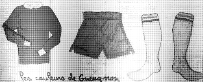
Les couleurs de Gueugnon